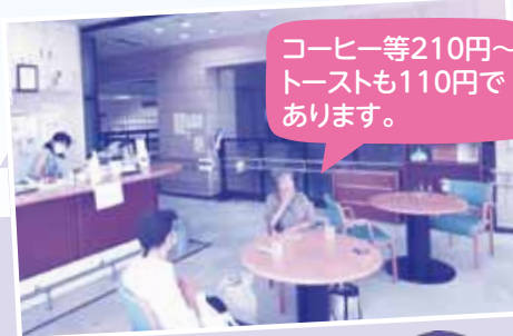
コーヒー等210円～トーストも110円あります。