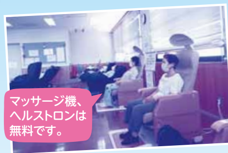
マッサージ機、ヘルストロンは無料です。

皆様、希望の家をご存知ですか。 大治南小学校の西側、丸い緑色の屋根が特徴の3階建ての建物で、大治町在住の方なら誰でも利用できる施設です。 2階の地域福祉センターには、囲碁や将棋を打てる部屋、マッサージ機やヘルストロン、お風呂やカラオケルームも完備しております。娯楽室ではテレビを観ることもでき、お弁当等をお持ちしていただければ、1日過ごすこともできます。また、コーヒーが飲めるティラウンジもあります。