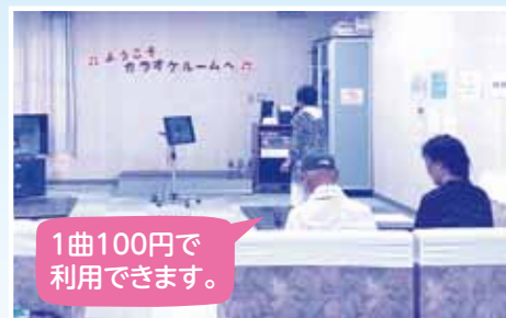
1曲100円で利用できます。