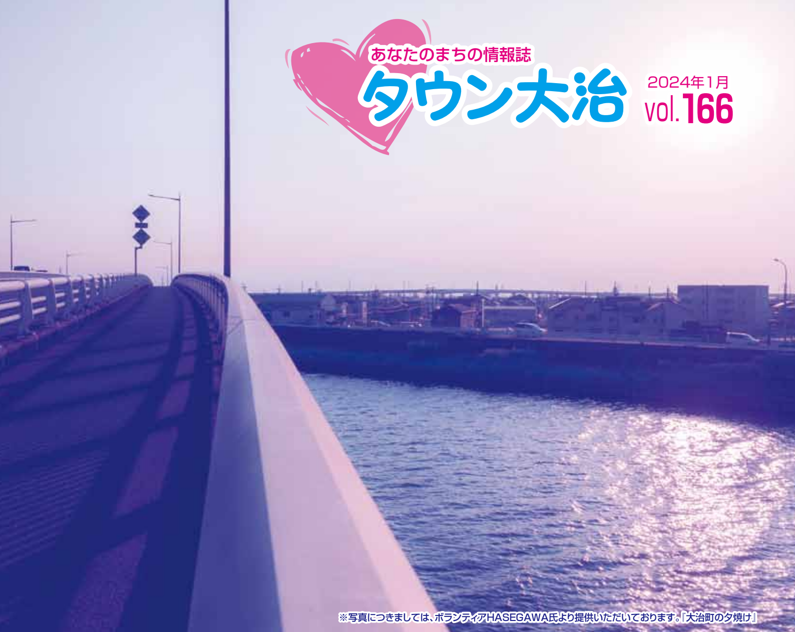
「大治町の夕焼け」