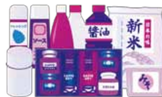
寄付の一部になります。