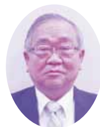
社会福祉法人 大治町社会福祉協議会