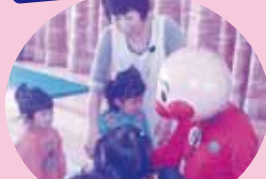
アンパンマンと握手