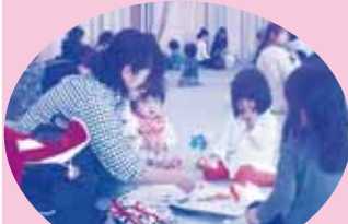
ママと一緒に作ったよ